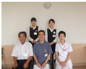
地域医療連携室スタッフ