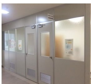
地域医療連携室 医療相談室